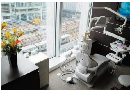
秋葉原駅前の複合型オフィス「秋葉原UDX」内のクリニック

当医療法人では、「安全」を前提にし た治療を行っています。治療を安全に行 うために、各種リスク分析を行い最大限 回避することが重要と考えております。 インプラント手術の最たるリスクとして 下顎神経麻痺があげられます。当院で は年間400件以上の手術を行っており ますが、そのような失敗や他のトラブル も一切ありません。術前の診断に加え精 密な検査を行い、経験に頼らず処置時 に安全装置を多用して安全への追及に 重点をおいているからです。リスクの大 部分が人為的な行為(診査・診断・治療 技術・経験)と考え真剣に取り組みたい ます。専門医による担当制にして治療